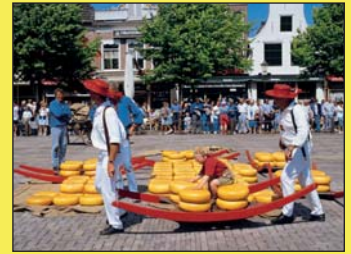
Alkmaar - Käsemarkt