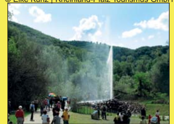
Andernach - Geysir